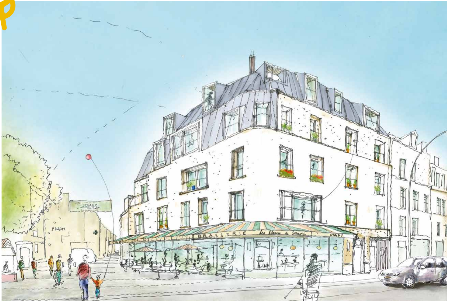
Vue de la future entrée de la rue Houdan (secteur piéton depuis la rue Voltaire)