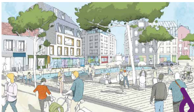
Vue sur la future place du Général-de-Gaulle depuis la rue Houdan (secteur piéton)