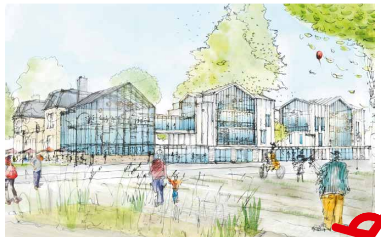
Vue du château de l'Amiral et de la future école des arts culinaires au débouché de la rue Houdan (secteur piéton)