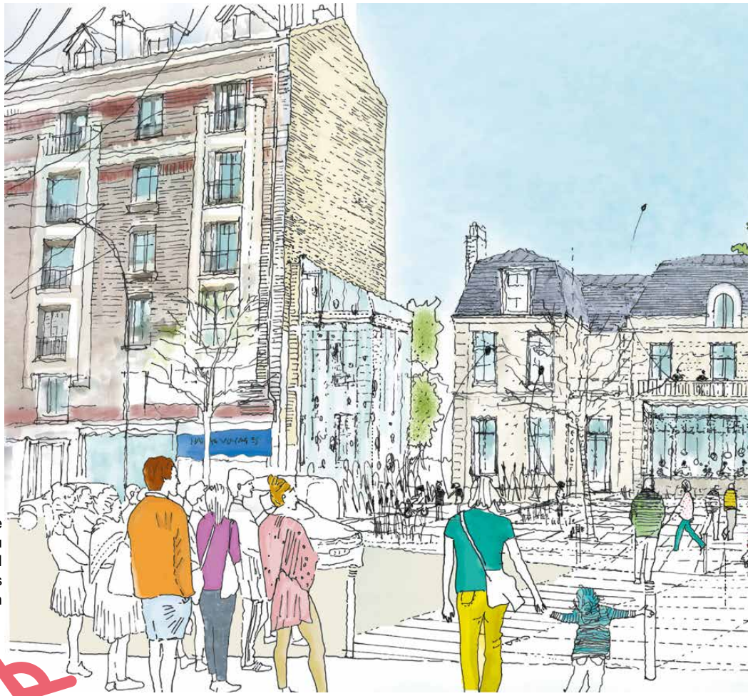
Vue de l'entrée du château de l'Amiral (de face) depuis la rue Houdan