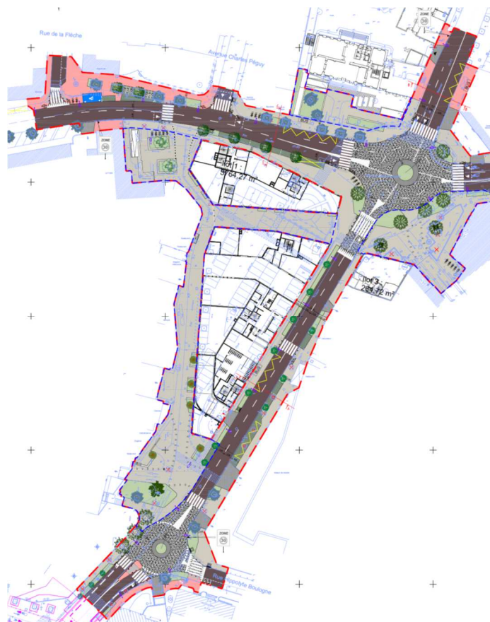
Schéma de principe du projet d'aménagement